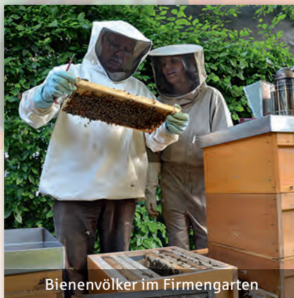
Bienenvölker im Firmengarten

Ziel der ökologischen Nachhaltigkeit ist es, Natur und Umwelt für die nachfolgenden Generationen zu erhalten. Deshalb haben wir uns einem ressourcenschonenden Wirtschaften verpflichtet und engagieren uns aktiv für den Umwelt- und Klimaschutz: Mit unserer Stromtankstelle leisten wir einen wichtigen Beitrag zur Etablierung der E-Mobilität im Landkreis. Durch die flächendeckende Umstellung unserer IT auf stromsparende „Thin Clients“ haben wir unseren Stromverbrauch nachhaltig reduziert. Und mit unseren mittlerweile 15 Bienenvölkern im eigenen Firmengarten tragen wir aktiv zu einem intakten Ökosystem bei und bringen die Natur direkt in das Herz von Ludwigsburg. Diese Beispiele zeigen, dass wir unsere Verantwortung ernst nehmen und unsere Umweltbilanz kontinuierlich verbessern.