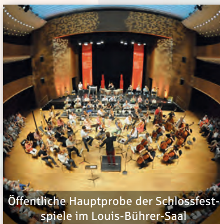
Öffentliche Hauptprobe der Schlossfestspiele im Louis-Bührer-Saal

Kunst ist nicht nur schön anzusehen, sondern sollte einen unverzichtbaren Stellenwert genießen. Vielfältige Kulturangebote tragen dazu bei, sich mit der Region, in der man lebt, zu identifizieren. Deshalb muss Kultur vor Ort gelebt, inspiriert und gefördert werden. Und deshalb gehört die Erhaltung der kulturellen Vielfalt im Kreis zum Kern unseres gesellschaftlichen Engagements. Die Bandbreite der von uns unterstützten kulturellen Aktivitäten ist groß: Sie reicht von Konzert- und Musikveranstaltungen (wie „coOpera“ oder „Jugend musiziert“) über Theater-Events wie den Theatersommer im Cluss-Garten bis hin zu Großveranstaltungen wie den „Kreissparkasse Ludwigsburg musicOpen“. So ermöglichen wir allen Menschen den Zugang zu Kunst und Kultur und machen den Landkreis lebenswerter.