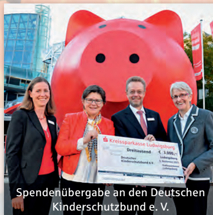
Spendenübergabe an den Deutschen Kinderschutzbund e. V.

Besonders wichtig ist uns die Unterstützung der vielen engagierten Menschen, durch die ein lebendiges Miteinander erst möglich wird. Es freut uns daher außerordentlich, dass viele unserer Mitarbeiter im Privaten ehrenamtliche Aufgaben übernehmen und so dem besonderen Selbstverständnis unserer Kreissparkasse eine ganz persönliche Note geben. Dieses Engagement unserer Mitarbeiter unterstützen wir mit einer Förderung von bis zu 500 Euro je Projekt.