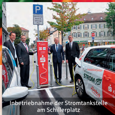
Inbetriebnahme der Stromtankstelle am Schillerplatz

Gut ausgebildete und motivierte Mitarbeiter sind der wichtigste Eckpfeiler unseres Erfolgs. Deshalb bieten wir auf Dauer ausgelegte Beschäftigungsperspektiven mit hervorragenden Entwicklungs- und Weiterbildungsmöglichkeiten. Allein 2015 haben wir mehr als eine Million Euro in Weiterbildungsmaßnahmen investiert. Und mit einer Ausbildungsquote von über 10 % sind wir einer der größten Ausbildungsbetriebe im Kreis und liegen weit über dem Branchenschnitt. Diese nachhaltige Ausrichtung wird durch vielfältige Zusatzangebote, wie eine betriebseigene Kindertagesstätte oder ein umfangreiches Gesundheitsmanagement, ergänzt. Regelmäßige Auszeichnungen wie das Siegel „ArbeitPlus“ oder das Zertifikat „Beruf und Familie“ belegen unsere verantwortungsvolle Beschäftigungspolitik.